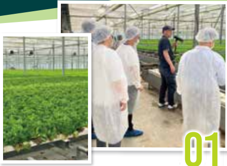
北海道 アド・ワン・ファーム

自動制御栽培システムを導入した大規模水耕栽培 徹底的なシステム管理で省人化・安定生産を実現