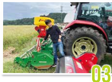
鳥取県 トゥリーアンドノーフ

自動搾乳ロボット&データ分析装置を導入し、 徹底的な「データ化&システム化」を実現